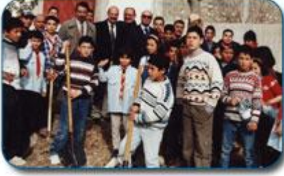
المشاركة في حملات النظافة

انطلاقاً من الأهمية البالغة و العناية الموصولة التي حظيت بها هذه الشريحة ونظراً للنتائج الايجابية التي حققتها المجالس البلدية للأطفال و مساهمتها الفعالة في إنكفاء روح المواطنة و تثبيت القيم لدى الناشئة ، فقد حرصت بلدية لمطة على أن يكون دور المجلس البلدي للأطفال رائداً و مثالا يحتذى به.