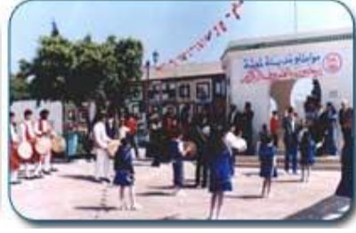
صورة من المهرجان