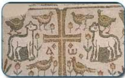
لوحة فسيفسائية جنائزية من العهد المسيحي متحف لمطة

و في سنة 46 ق م، أثناء الحرب الأهلية الرومانية، حالفت لبتيس (لمطة حاليا) "يوليوس قيصر" ضد الجمهوريين قبل معركة تابسوس التي انتهت بانتصار الشق القيصري.