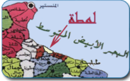
موقع لمطة في ولاية المنستير

تقع مدينة لمطة في الوسط الشرقي من البلاد التونسية على ضفاف البحر الأبيض المتوسط وهي تمتد على حافتي الطريق الجهوية 92 الرابطة بين سوسة والمنستير من جهة و المهديّة من جهة أخرى.