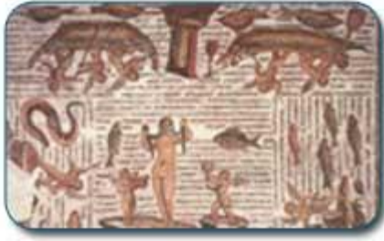
لوحة فسيفسائية تمثل فينوس بصدد الاغتسال