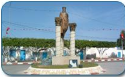
ساحة تيورو بلمطة