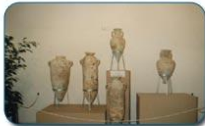
بعض القطع الخزفية الأثرية

ويتميز هذا المتحف بتأكيداته من خلال طريقة عرض القطع الأثرية، على الجانب التثقيفي و التعليمي معتمدا لبلوغ الهدف على أكبر عدد من البطاقات الإيضاحية و الرسوم البيانية التي تجعل الزائر في غنى عن أية إيضاحات إضافية.