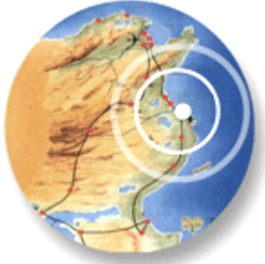
موقع لمطة من الجمهورية التونسية