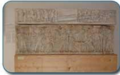
تابوت من العهد البيزنطي

و بالإضافة إلى هذه اللوحات تشتمل هذه القاعة على تحفة فريدة من نوعها هي عبارة عن تابوت مسيحي من الرخام يحمل نقوشا تستقي مواضيعها من الفن الوثني و المسيحي في آن واحد.