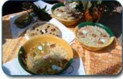
بعض أنواع البسيصة