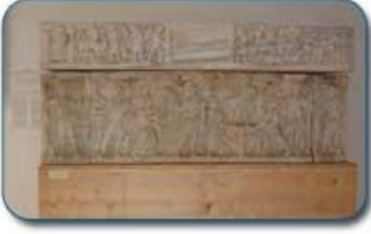
تابوت من العهد البيزنطي

في القرن السادس و السابع الميلادي لما أصبحت البلاد التونسية بيزنطية، إزداد ازدهار لبتيس (لمطة حاليا) إلى حد أنها أصبحت مع مدينة قفصة مركز إقامة القائد الأعلى للجيش البيزنطية بالبلاد وبالتحديد سنة 533 م عبرت القوات البيزنطية تحت قيادة الجنرال "بيليزار" مدينة لبتيس (لمطة حاليا) وأصبحت مقرا للحاكم العسكري بولاية بيزاسينا.