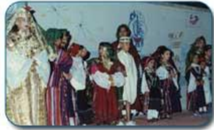
صورة من المهرجان

ويقام مهرجان لبتييس في كل صانفة و يضيفي على المدينة بهجة و حيوية و تبرز فيه خصوصيات المدينة و أصالتها و ثقافتها التي ما انفكت تطور عبر العصور.